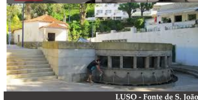
LUSO - Fonte de S. João

Luso na clandestinidade de ÁLVARO CUNHAL