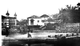
Data provável da imagem - 1916